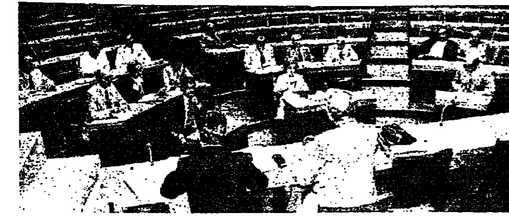
لجنة الادارة والعدل انشاد اجتماعها امس

اجريت محاولة لتفريب كياورفامات من حشيشة الكيف التي مصر عبر برقا بيروت . وانتم شخص بعض ط، مساحه يله ورام عبيدة التفريب، وهو يعمل كطبخ بضائع وتبين انه متوار من الانتظار . وقد ضبطت الاحزات في صندوقين الكرتون كان موضوعا على الترفيف دون ان يتم اذخاله الى الصالون